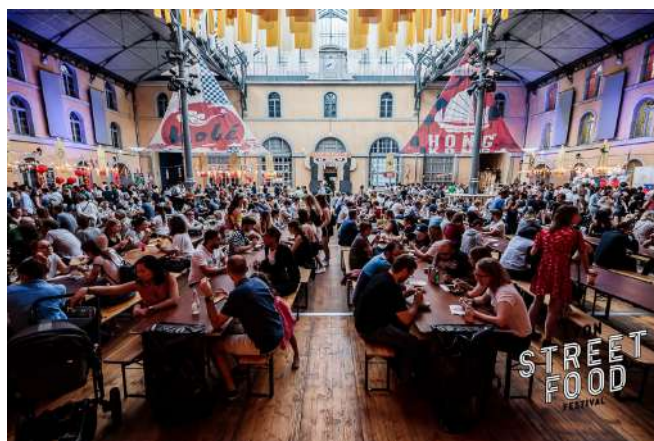
Edition 2019 - 30 000 personnes étaient au rendez-vous

Ainsi, 5 projets food ont été pré-sélectionnés et 2 projets de boissons ont retenus l'attention pour des contrats de fournisseurs exclusifs de mélanges de thés et de Tchaï.